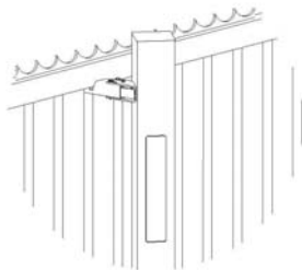
Bovengeleiding op geleideportaalbeens